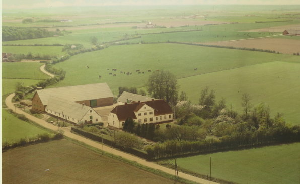
Luftfoto af Treldegård fra 1960