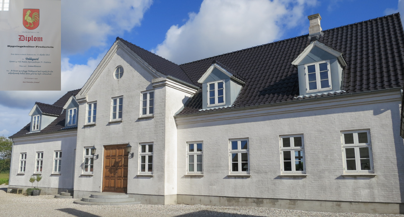
Nyt stuehus i 2009